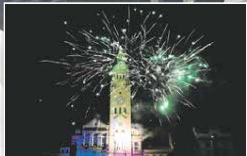
Se starým rokem jsme se rozloučili ohňostrojem!