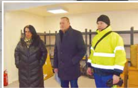
RE-USE centrum v Anenské ulici zahájilo provoz