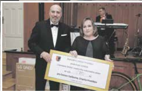
Plesovou sezonu zahájil tradiční městský ples